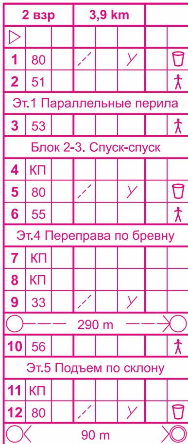
Схема дистанции 2 класс мужчины/женщины