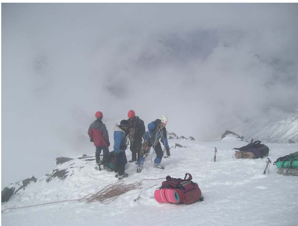
Фото 30. На пер. Любимых жён (2А, 4370).