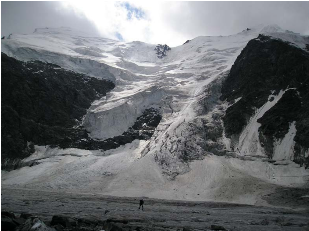
Фото 14. Пер. Тронова (3А, 3800) со стороны лед. Менсу.

Пересекли лед. Менсу. Ночёвка (GPS: CAMP11) на левобережной морене у начала подъёма в цирк перевалов Титова, Дружба (фото 16).