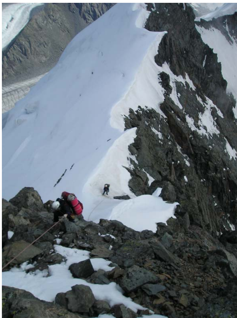
Фото 10. Спуск с в. Героическая Корея (3900) на восточный гребень.