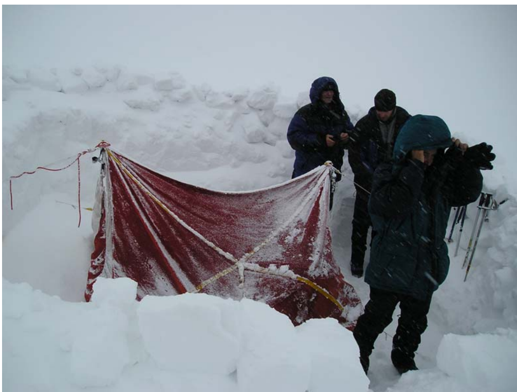
Фото 27. Вариация 2 на тему «Как перезимовать лето».