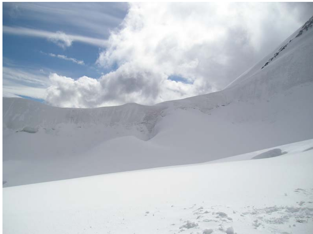
Фото 22. Седловина пер. ТКТ (3А, 4115) со стороны верхнего плато лед. Бол. Берельский.