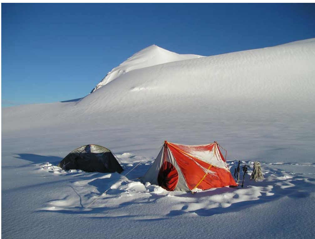
Фото 32. Лагерь на Западном плато под в. 20-летия Октября (Корона Алтая).