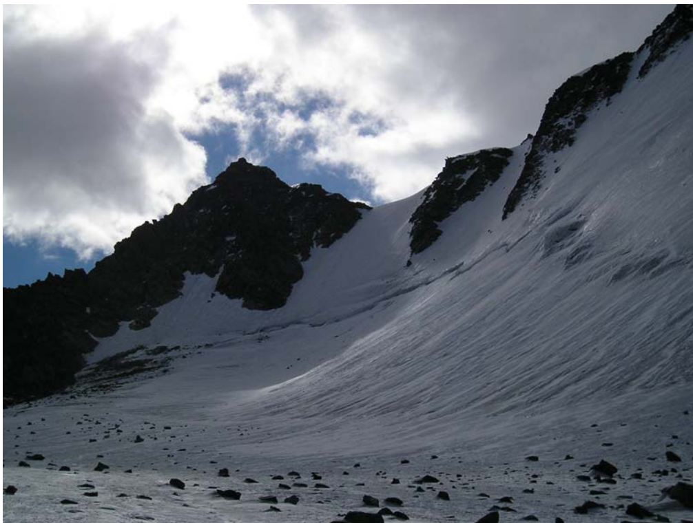
Фото 3. Пер. Делоне (2Б, 3400) со стороны лед. Аккемский.