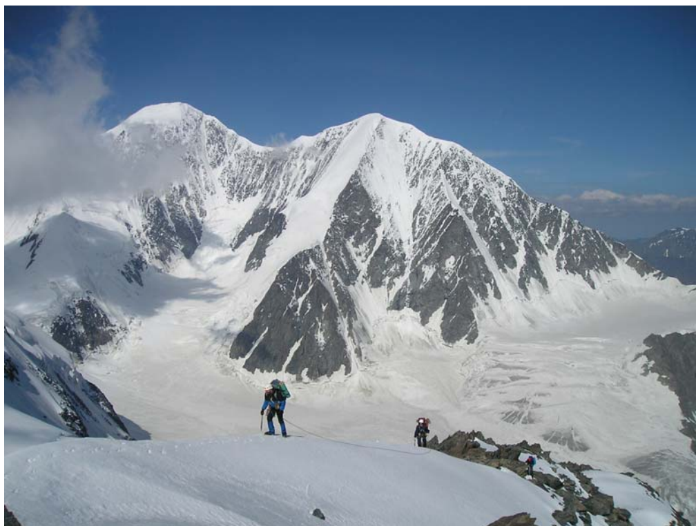
Фото 8. Подъём на в. Героическая Корея (3900).

Спустившись с вершины, прошли несколько незначительных возвышений в гребне (фото 11). Отдельные участки – в связках. Дошли до вершинки, от которой на северо-восток отходит массивное, заснеженное в верхней части, ребро. Здесь мы наткнулись на интересную находку: обнаружили тур (GPS: TUR1953) с запиской первовосходителей - отряда альпинистской экспедиции ВЦСПС - от 7 августа 1953 г. (!) (подробности читай в «Лирическом отступлении 1» на стр. 19-21). Попробовали пройти одну верёвку на спуск по северо-восточному ребру. Снег ко второй половине дня раскис, склон стал реально лавиноопасным, поэтому вновь поднялись к вершинке, и продолжили траверс гребня в направлении пер. Тронова. От «вершинки»-предвершины можно двигаться в связках. Непосредственно перед спуском на седловину пер. Тронова на крутом снежно-ледовом участке повесили 40 м перил.