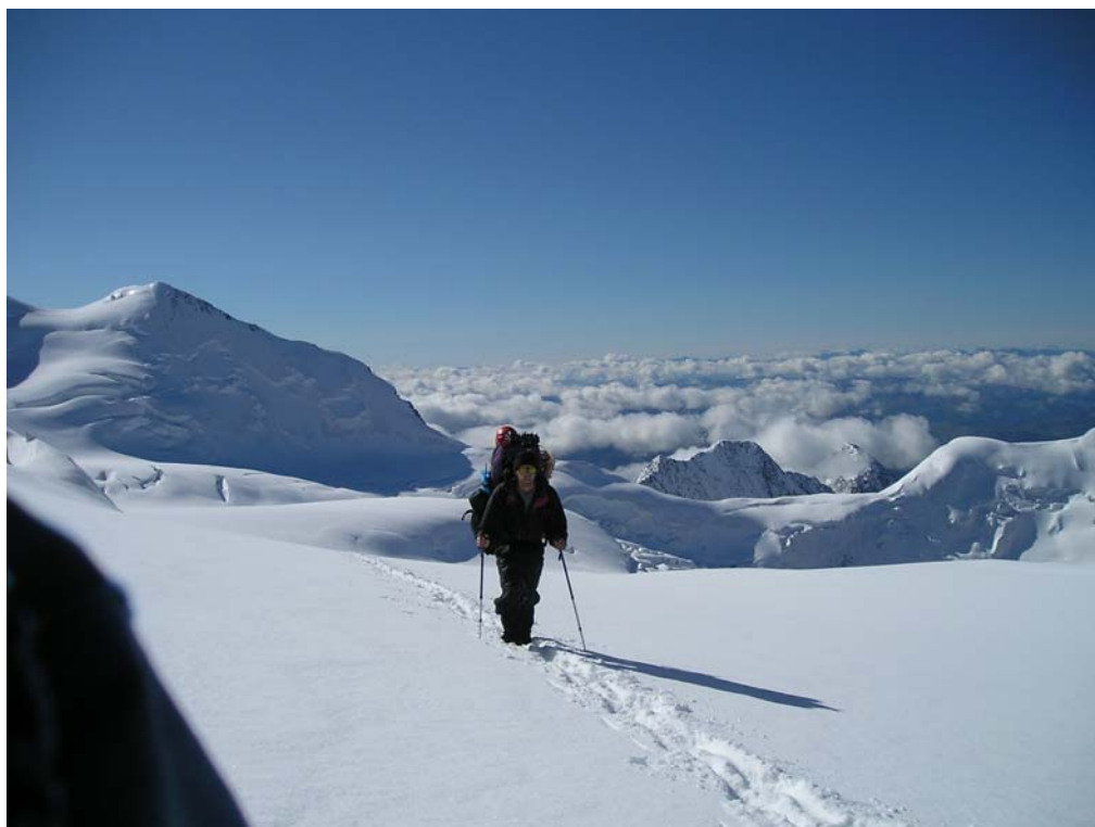
Фото 33. По Западному плато.

На следующий день за 40 мин., по языку ледника довольно круто спускающегося на север, вышли к «бараньим лбам». Обойдя их слева, за 40 мин. по каменной осыпи спустились на морену лед. Леонида. Далее 40+15 мин. - вниз до морены лед. Мюшту-Айры.