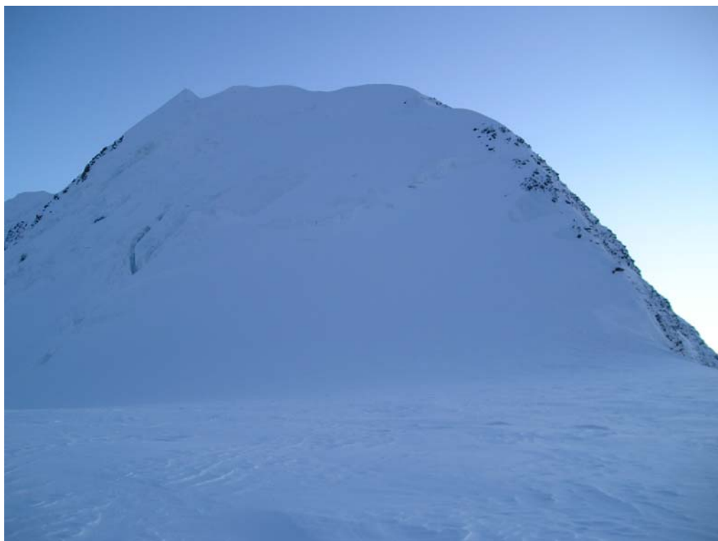
Фото 28. Зап. Белуха (4400) и пер. Любимых жён (2А, 4370) со стороны Центрального плато.

Спустившись на «стол» - верхнюю часть Западного плато, за 40 мин. пересекли его. Связавшись, продолжили движение вдоль правого (по ходу) края Западного плато (фото 31). Траверсируя склон, постепенно спустились на нижнюю, равнинную часть плато. Ночёвка (GPS: CAMP19) (фото 32).