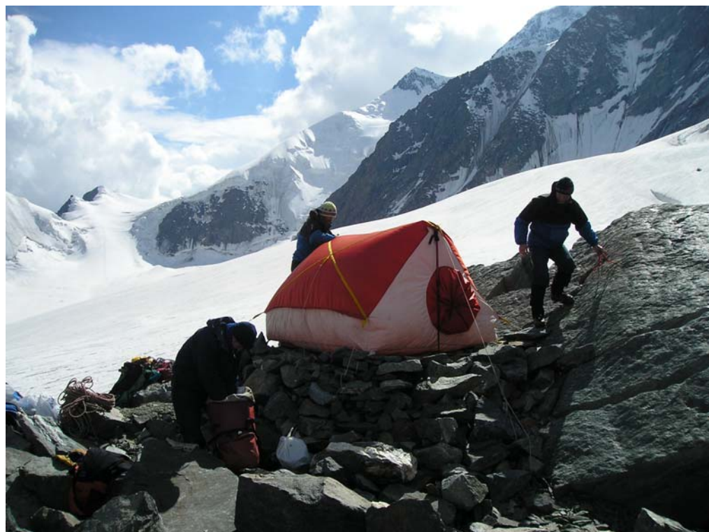
Фото 20. Лагерь на верхнем плато лед. Менсу.