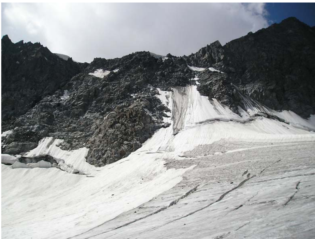
Фото 17. Скальный взлёт, выводящий на верхнее плато лед. Менсу

Из-за нестабильной погоды приняли решение выходить на Центральное плато через пер. ТКТ (3А, 4115).