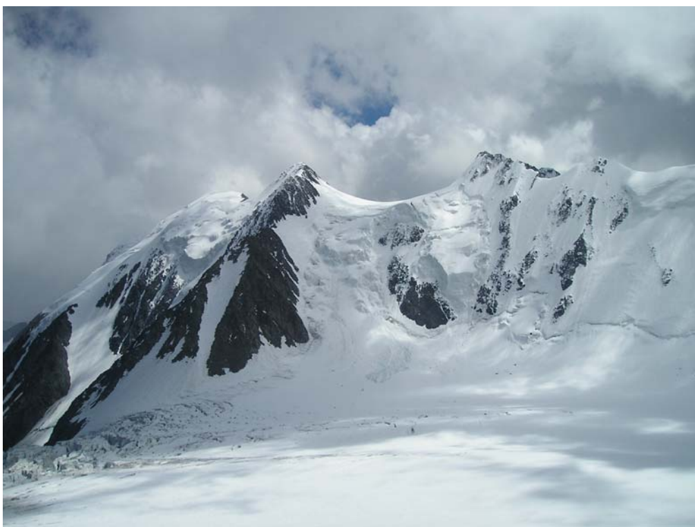
Фото 4. Верхнее плато лед. Менсу. Вид на в. 50 лет КПСС (4060), пер. Тронова (3А, 3800), в. Героическая Корея (3900), пер. Высоцкого (3А, 3670), в. Сапожникова (3950).