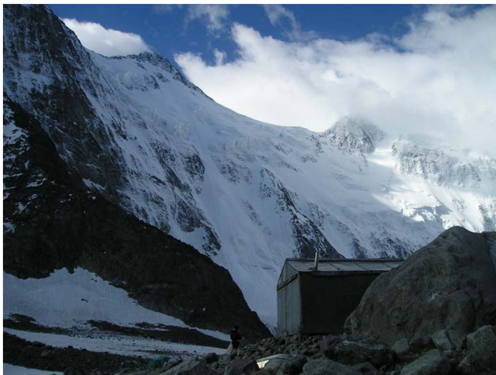
Фото 2. Аккемская стена Белухи. Вид с Томских стоянок.

Далее - спуск на верхнее плато лед. Менсу (фото 4). Склон снежно-ледовый, в верхней части (20 м) крутизной до 45°, полузасыпанный бергшнур, затем склон выполаживается. До бергшнура спуск «в три такта», далее пешком в обход простого ледопада до последних скал слева перед ледопадом на нижнее поле лед. Менсу. Спуск до скал (GPS: CAMP05) занял 40 мин.