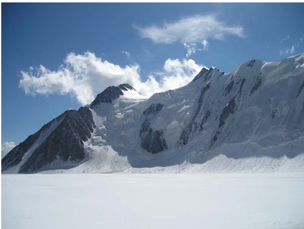
Фото 5. Пер. Высоцкого (3А, 3670). Вид с верхнего плато лед. Менсу из-под пер. Большое Берельское седло (3А, 3520).

30 мин. понадобилось, чтобы подняться от подножия перевала под первый ледовый сброс. Обошли его справа (по ходу). (Страховка индивидуальная.) Склон немного выполаживается. Подошли под следующий, более внушительный ледовый сброс и по снежному мосту через бергшрудн (фото 6), с попеременной страховкой поднялись под скалы слева (по ходу). Дальнейшее движение вдоль скал (3-4 верёвки) (фото 7), с постепенным смещением вправо (по ходу) в направлении седловины, по снежно-ледовому склону крутизной до 50°. Повесили 11×40 м перил. Через 3,5 ч. подъёма склон стал выполаживаться. В связках с одновременной страховкой выходим к центру седловины (GPS: САМР07). Седловина широкая, мест под палатки хоть отбавляй, но в последующие два дня нам и здесь стало неудобно – не знали, куда деваться от сильного штормового ветра и дождя.