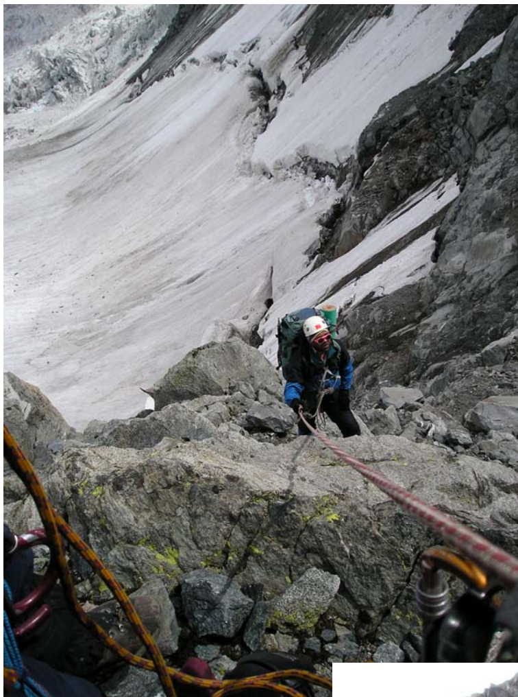
Фото 18. Подъём на верхнее плато лед. Менсу. Средняя часть скального взлёта.