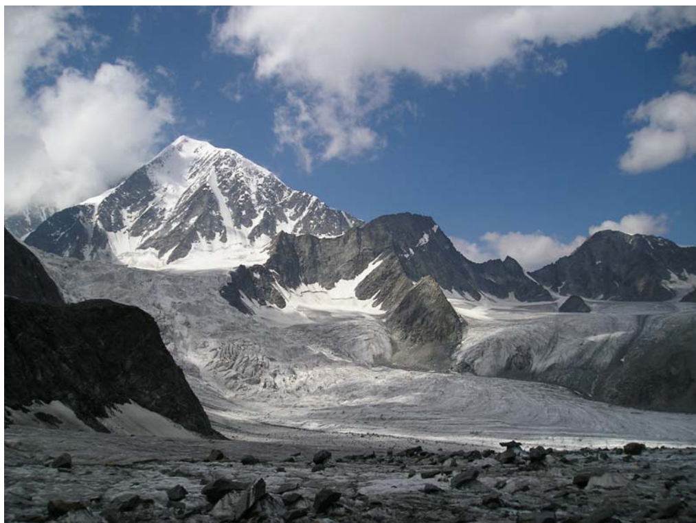
Фото 16. Верховья лед. Менсу.