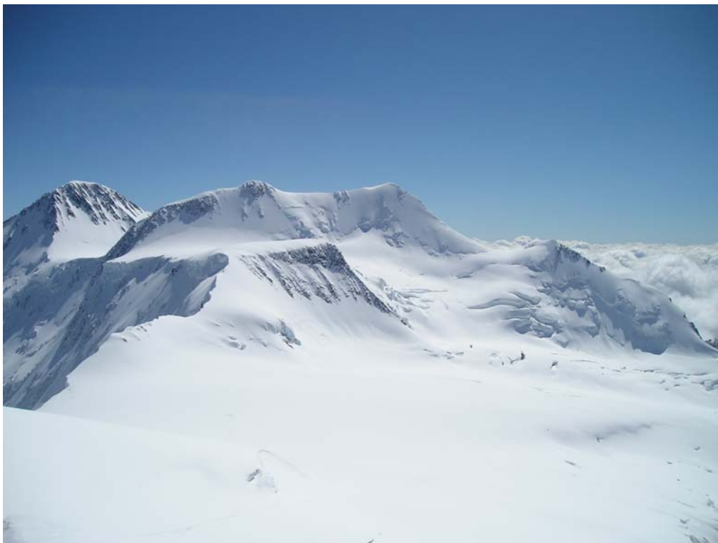
Фото 31. Западное плато – затерянный мир. Вид с в. 20-летия Октября (Корона Алтая) (4167).