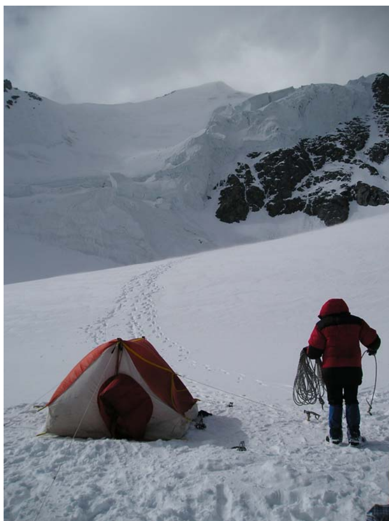
Фото 21. Лагерь на верхнем плато лед. Бол. Берельский.