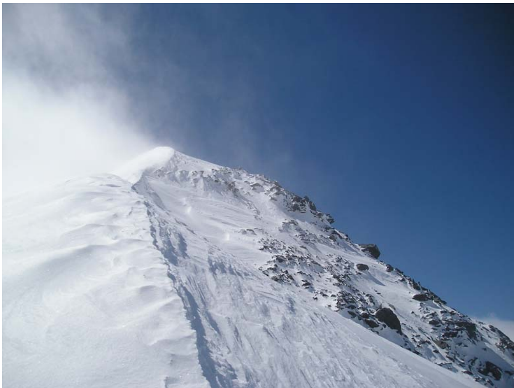
Фото 29. Гребень Зап. Белухи (4400).