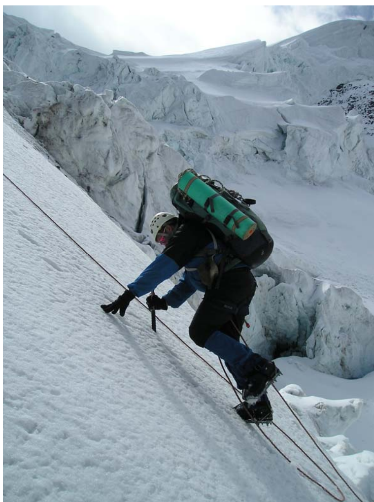
Фото 7. Подъём на пер. Высоцкого (3А, 3670).