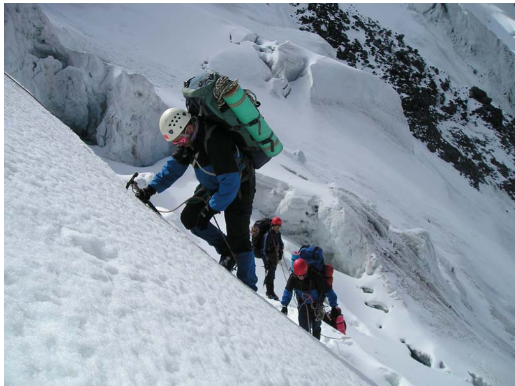
Фото 6. Подъём на пер. Высоцкого (3А, 3670).