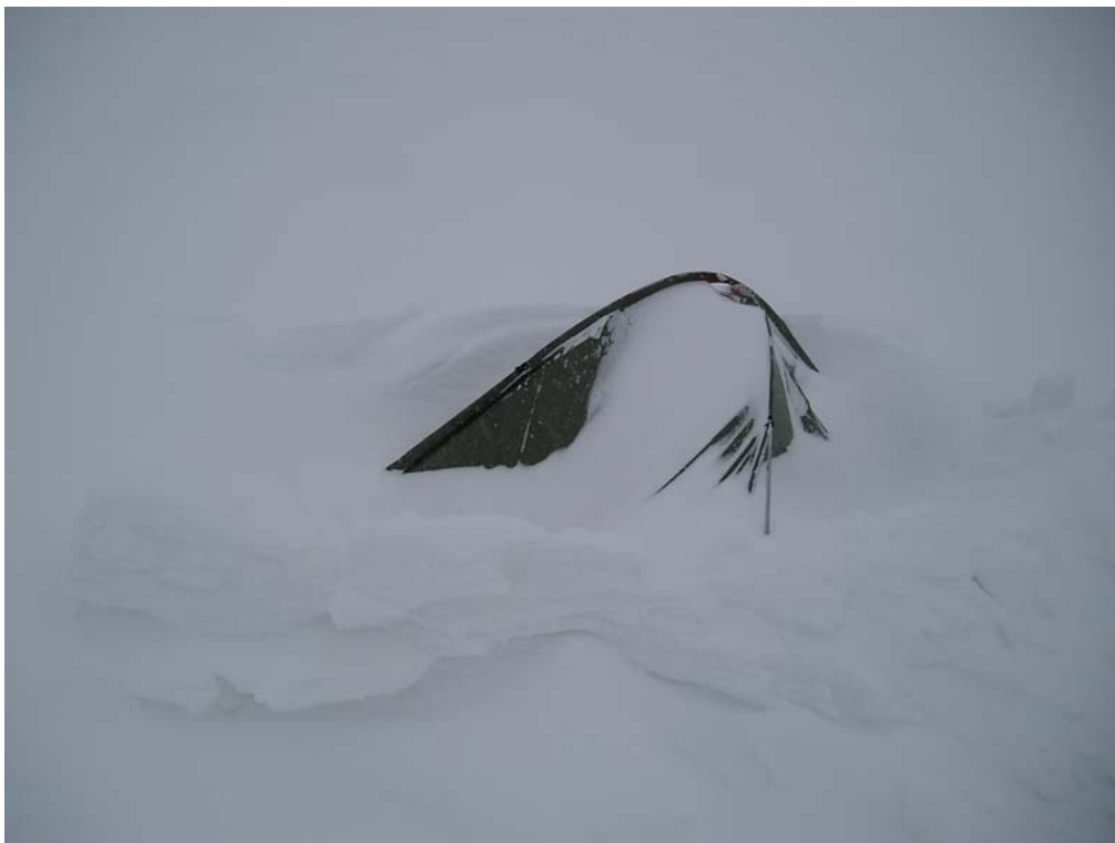
Фото 26. Вариация 1 на тему «Как перезимовать лето».