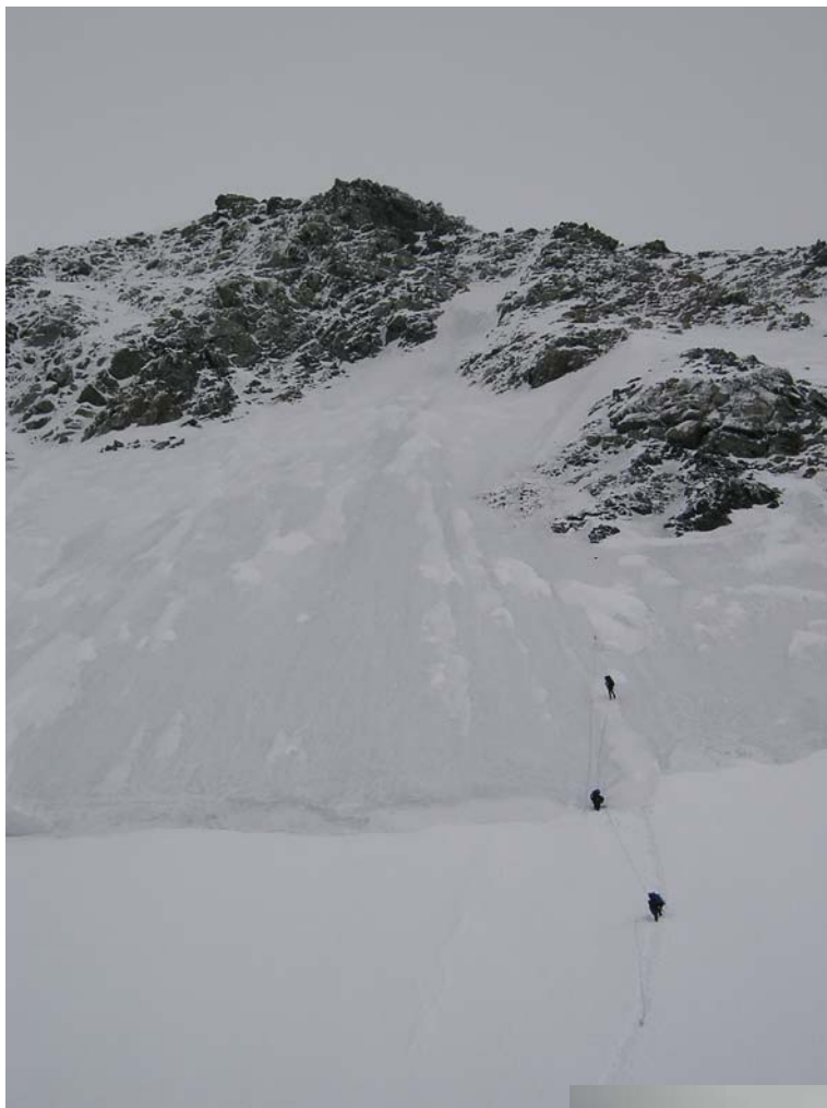
Фото 36. Спуск с пер. 20-летия Октября (3А, 4167).