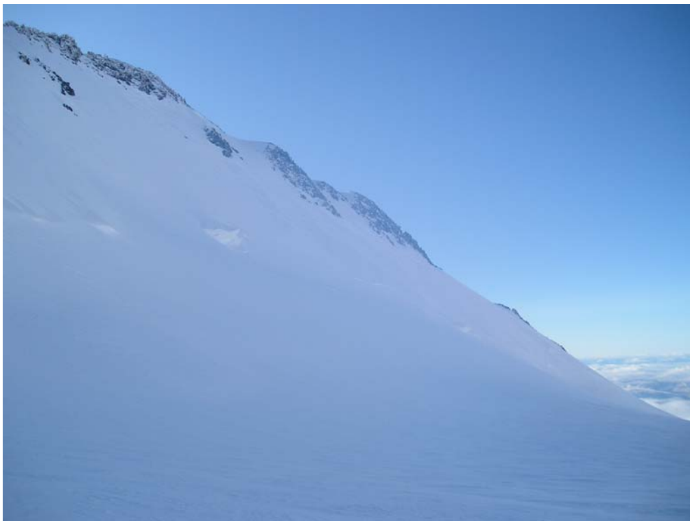
Фото 24. Пер. Белухинский. Вид с места ночёвки на Центральном плато.