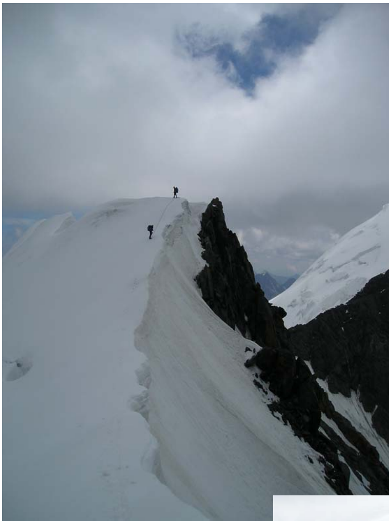
Фото 11. Участок траверса массива в. Героическая Корея (3900).