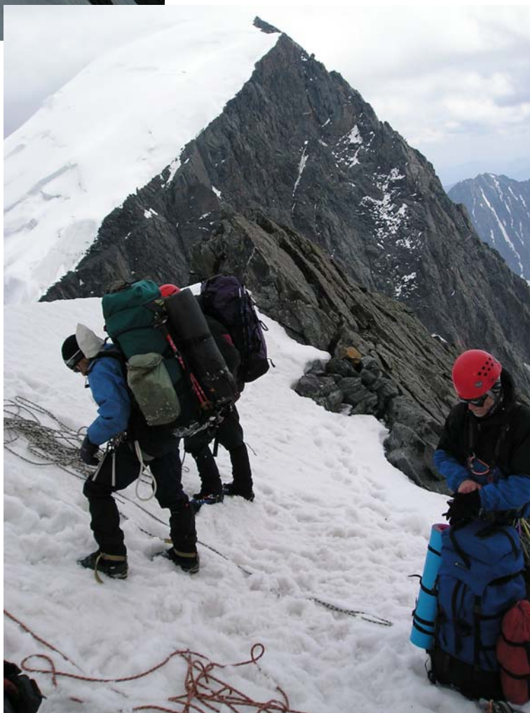
Фото 12. На предвершине Героической Кореи.