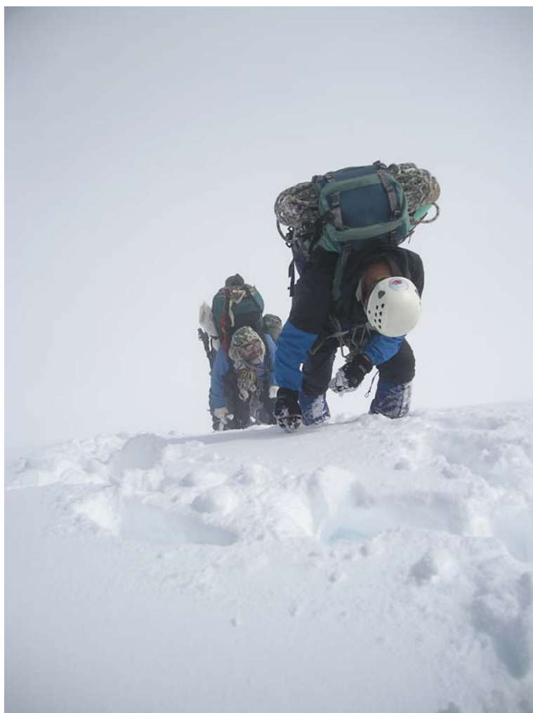
Фото 23. Подъём на Центральное плато Белухи.