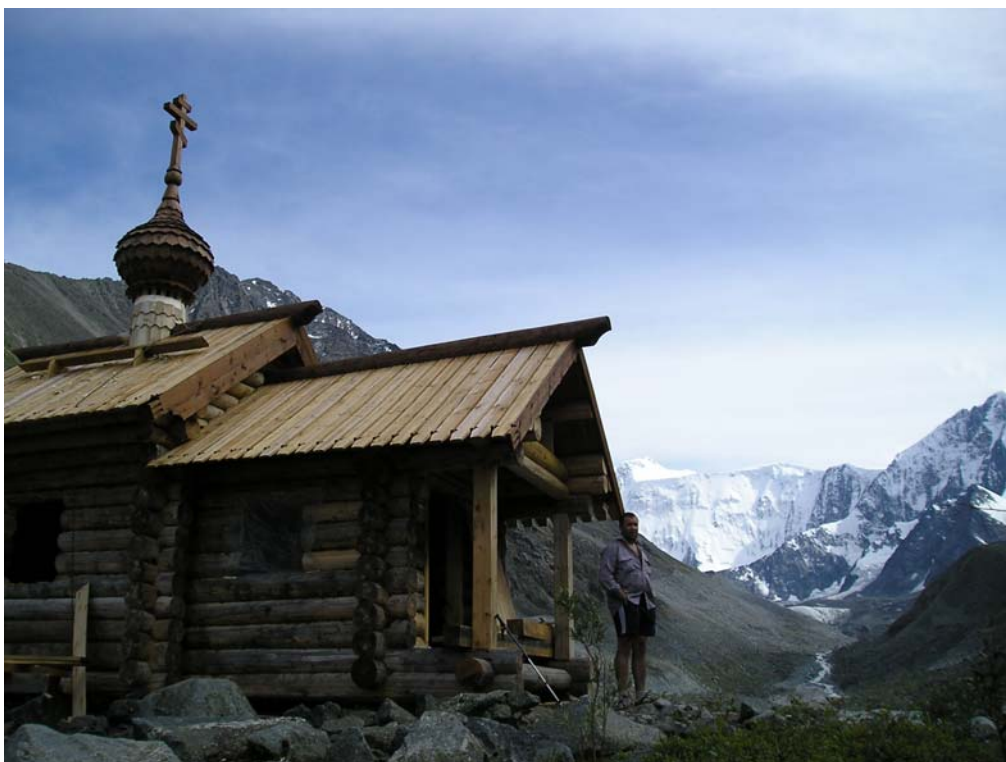
Фото 1. Часовня у подножия Белухи.

За 3×30+15+30 мин. дошли до ГМС на Аккемском озере. Через 10 мин. были у домиков-бочек спасателей. Тропа вдоль озера местами заболочена. За 40 мин. дошли до места переправы на правый берег Аккема ниже прорыва реки через старый моренный завал. Через реку в этом месте смонтирован мостик (правда достаточно экстремальный). После переправы, по тропе, идущей по старой боковой морене, прошли 30 мин. до строящейся, силами спасателей часовни (фото 1). Пройдя ещё 10 мин., встали в кармане правобережной морены, у р. Караюк (GPS: CAMP03). Травка, жимолость, последние дрова.