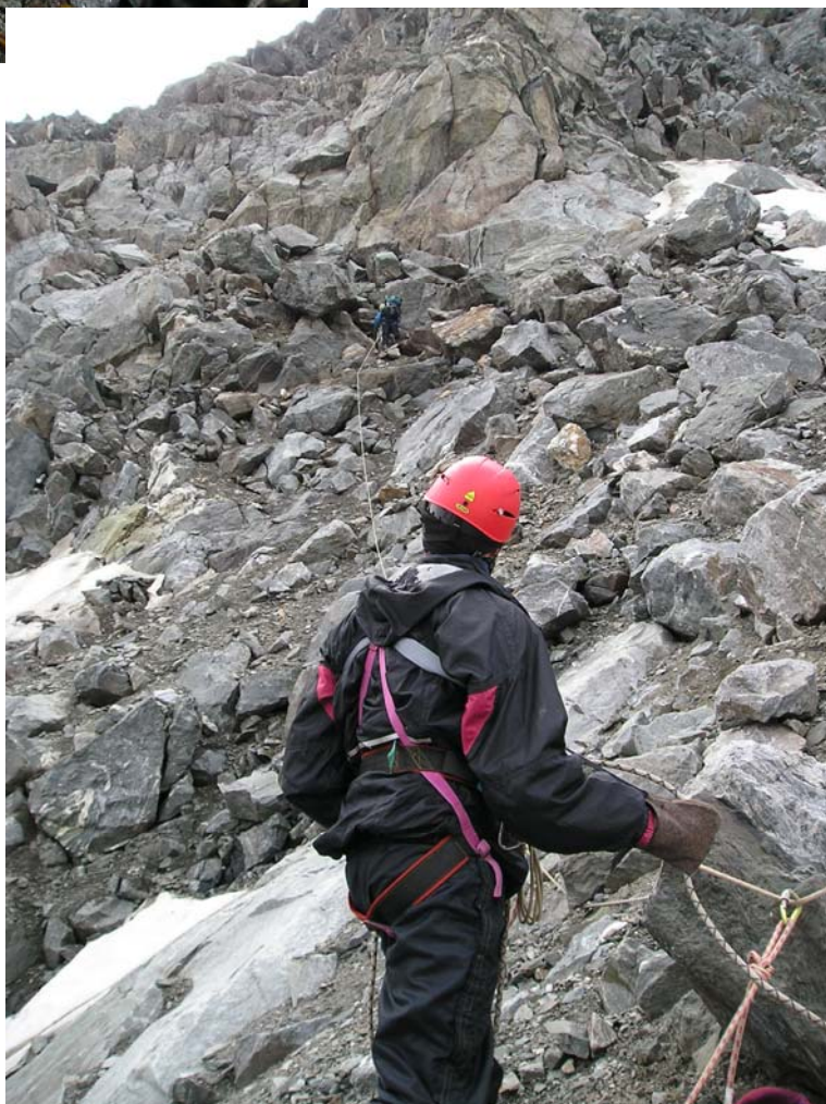
Фото 19. Подъём на верхнее плато лед. Менсу. Верхняя часть скального взлёта.