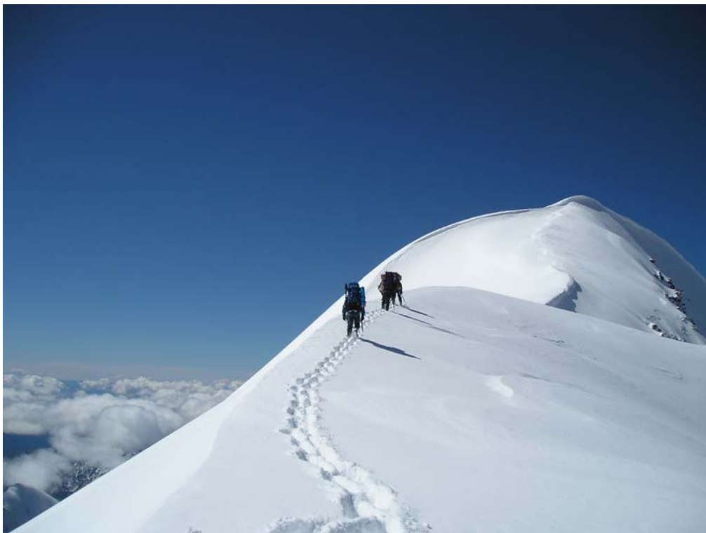
Фото 34. На гребне в. 20-летия Октября (Корона Алтая) (4167).