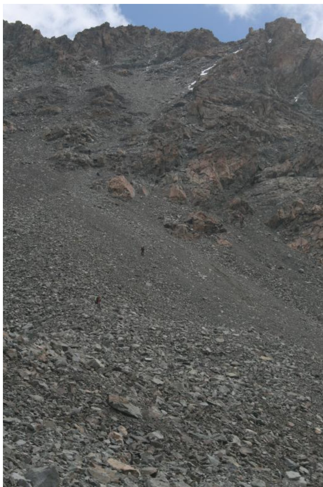
Фото 29. Перевал Буревестник с запада