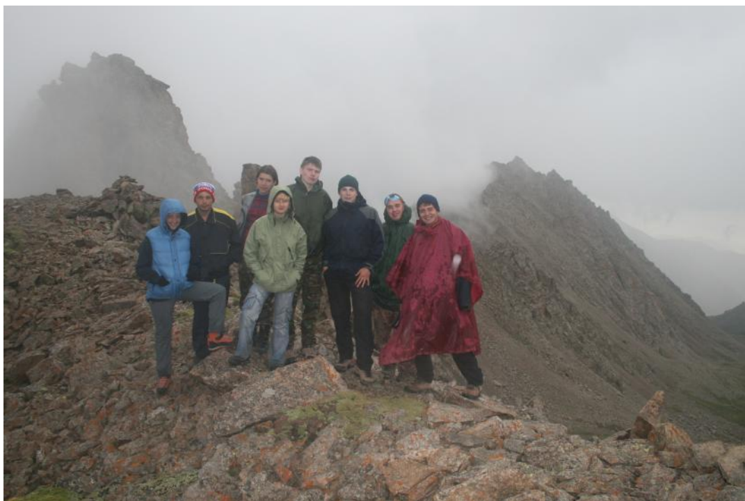
Фото 9. Группа на седловине безымянного перевала (№ 274) (1А,3715)