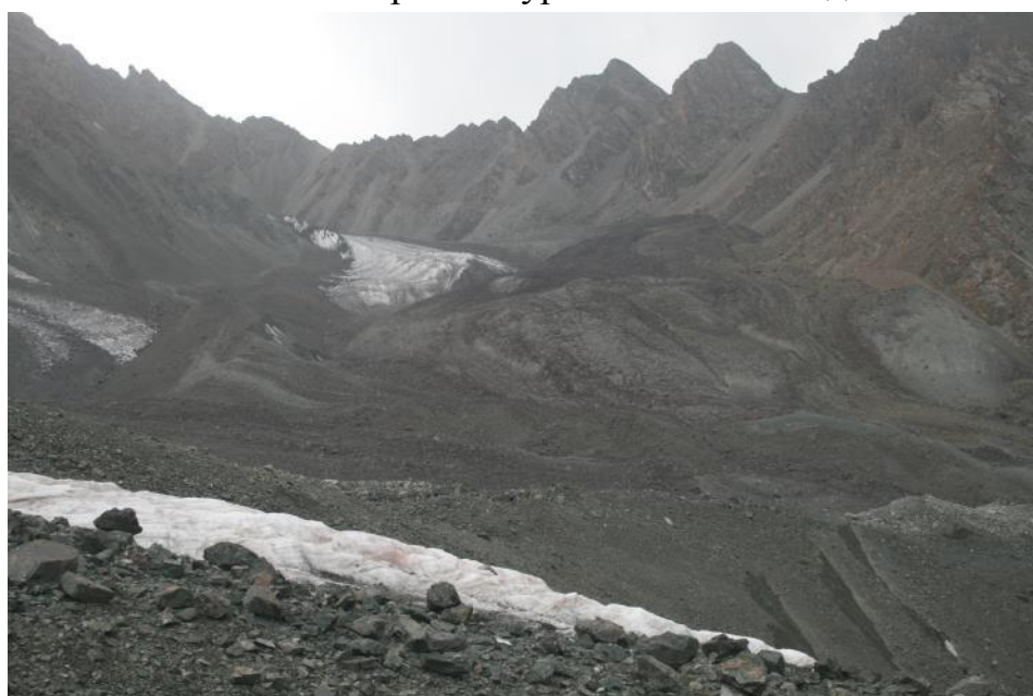
Фото 30. Вдали виднеется пер. Чертов палец