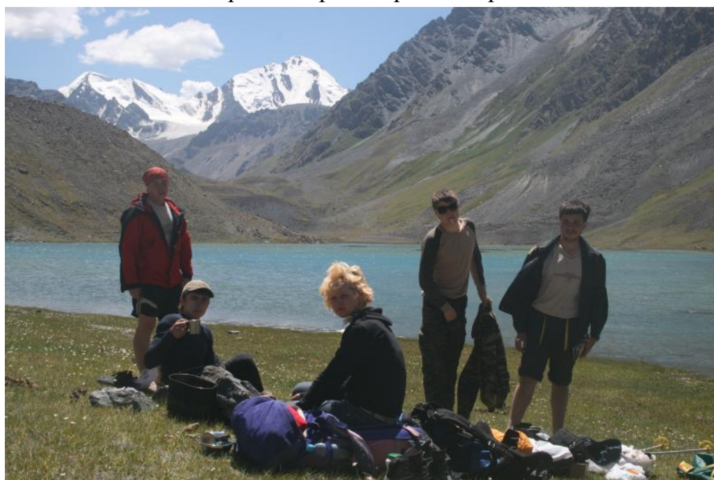
Фото 12. Обед у второго озера