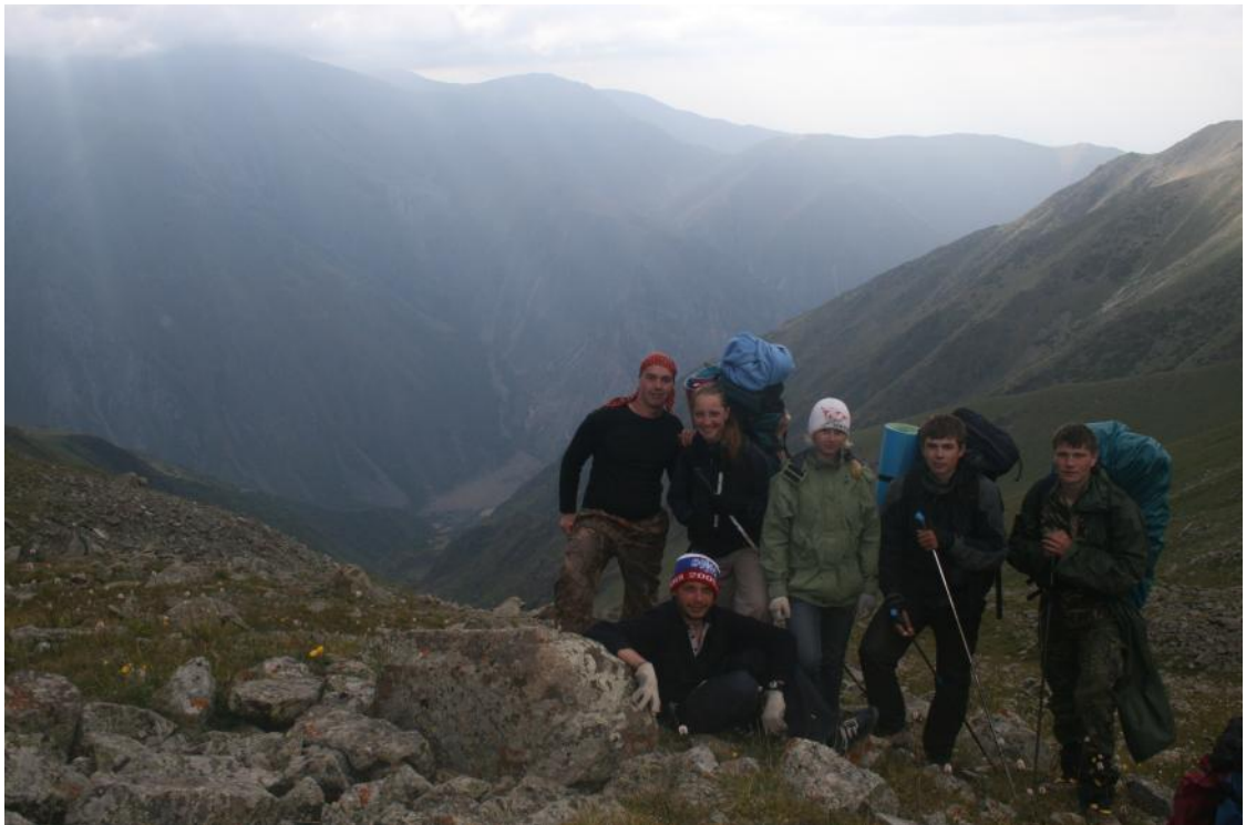
Фото 36. Группа в долине р.Ачикташ