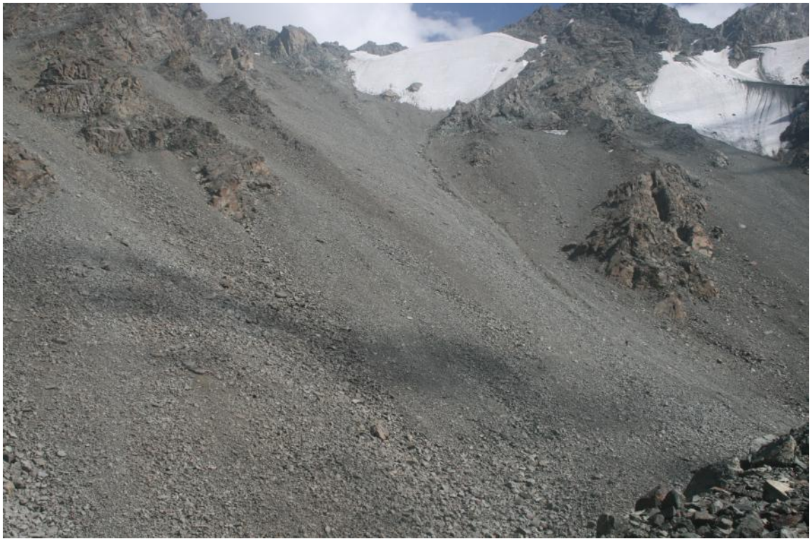
Фото 35. Перевал Чертов палец с запада