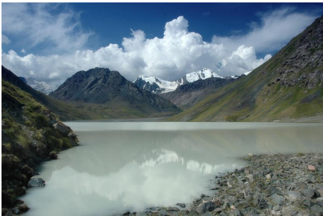
Фото 13. Третье озеро (мутное) в верховьях долины р.Иссык-Ата