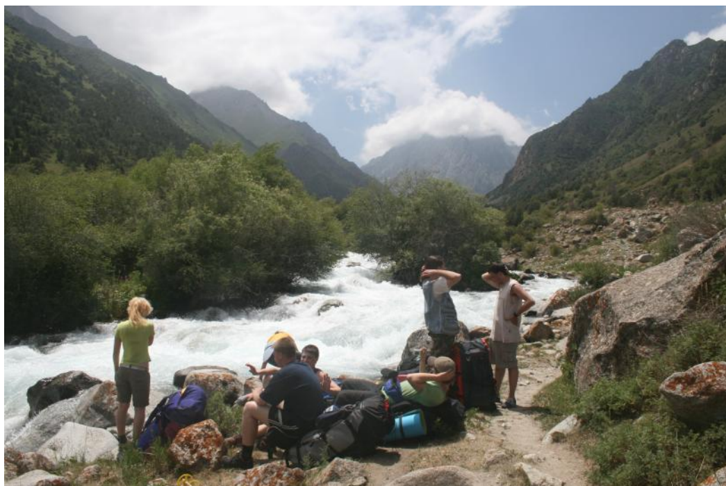
Фото 3. Долина р.Иссык-Ата в среднем течении