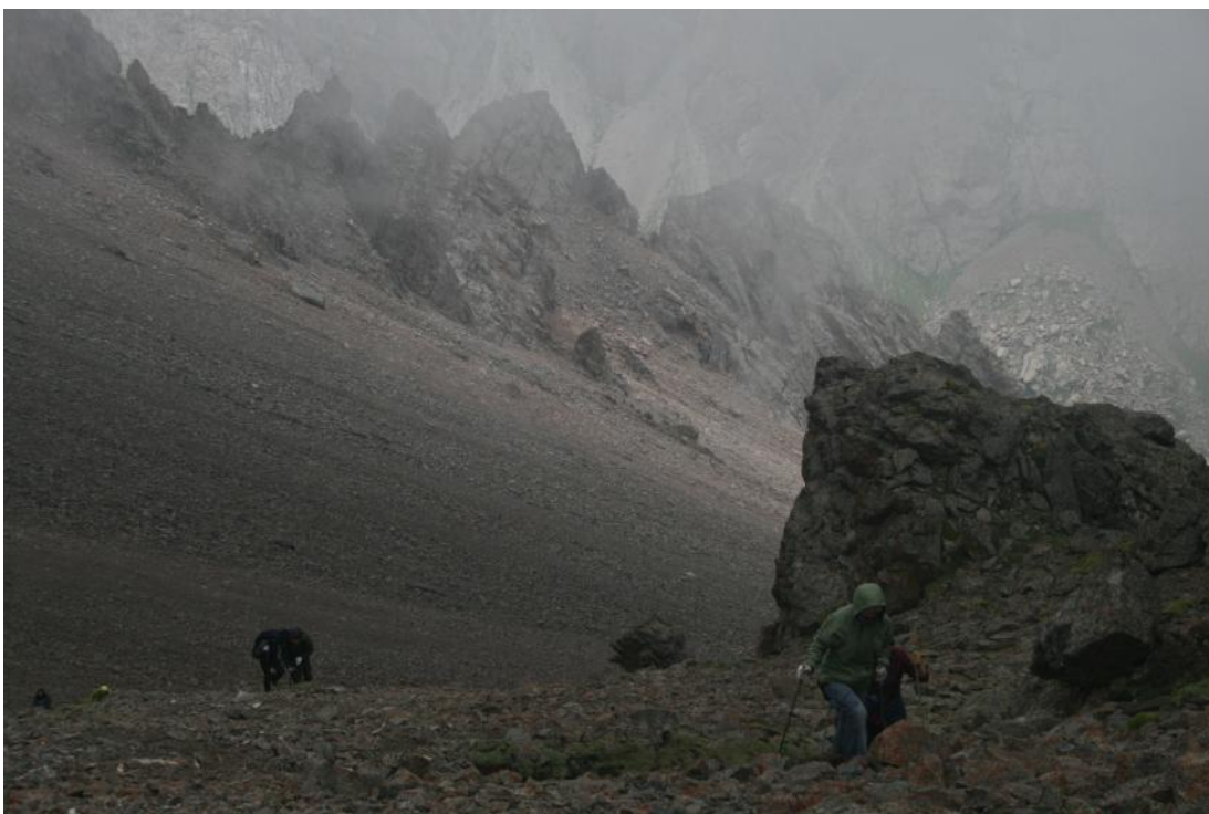
Фото 8. Выход на седловину