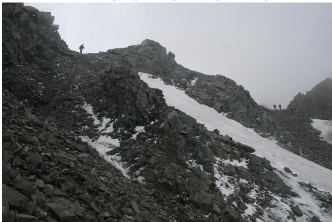
Фото 34. Путь спуска в верхней части с пер. Чертов палец