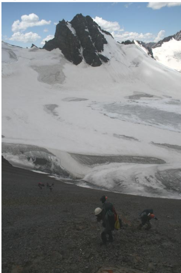
Фото 18. Подъём на перевал