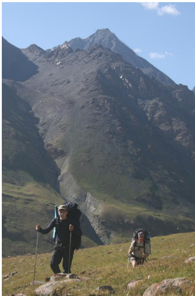
Фото 15. Подъём по долине безымянного ручья