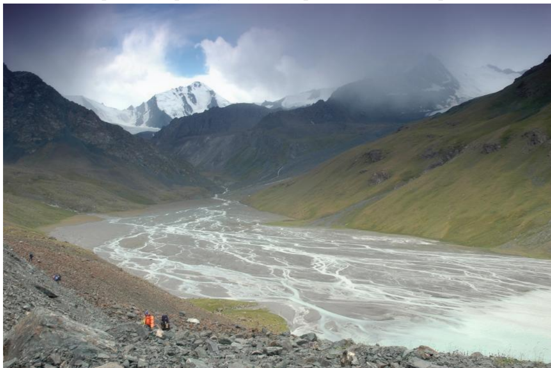
Фото 14. Многочисленные притоки третьего озера