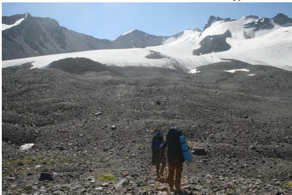
Фото 16. Подъём по морене к лед.Петросянца 2