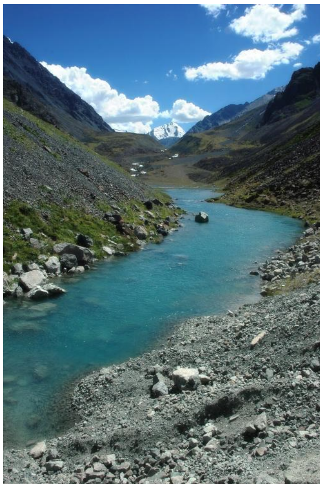
Фото 11. Первое озеро в верховьях р.Иссык-Ата