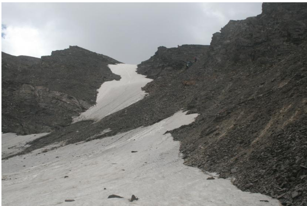
Фото 20. Спуск по крутому осыпному кулуару