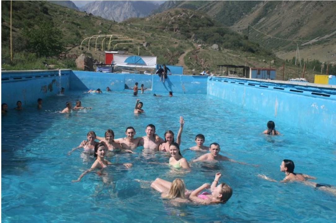
Фото 1. Горячие источники в пос.Иссык-Ата