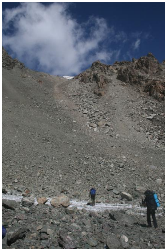
Фото 31. Начало подъёма на перевальный взлёт пер.Чертов палец