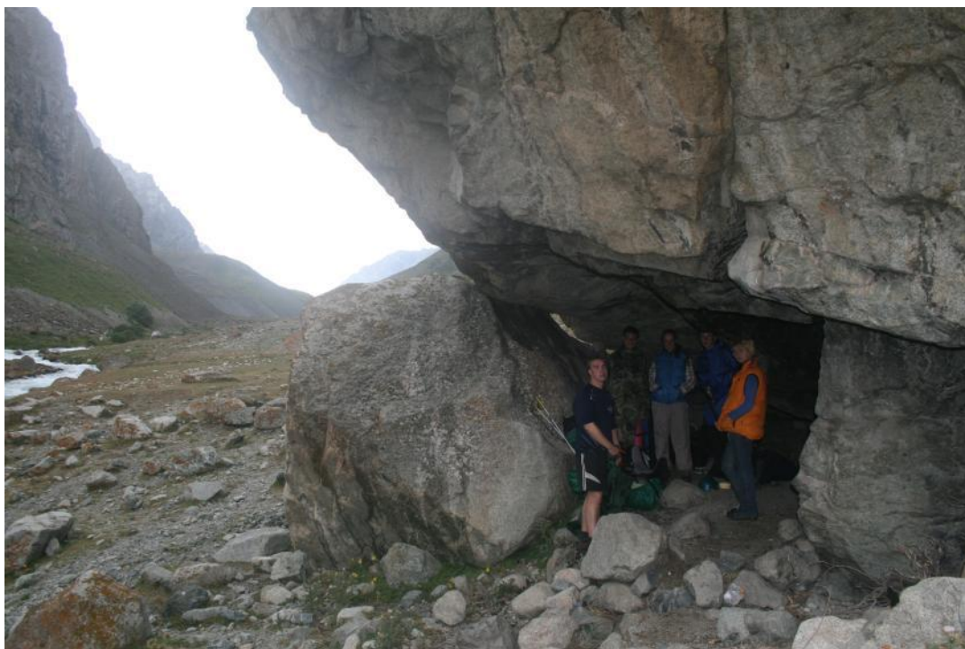
Фото 23. Прячемся от дождя под скалой Джарташ