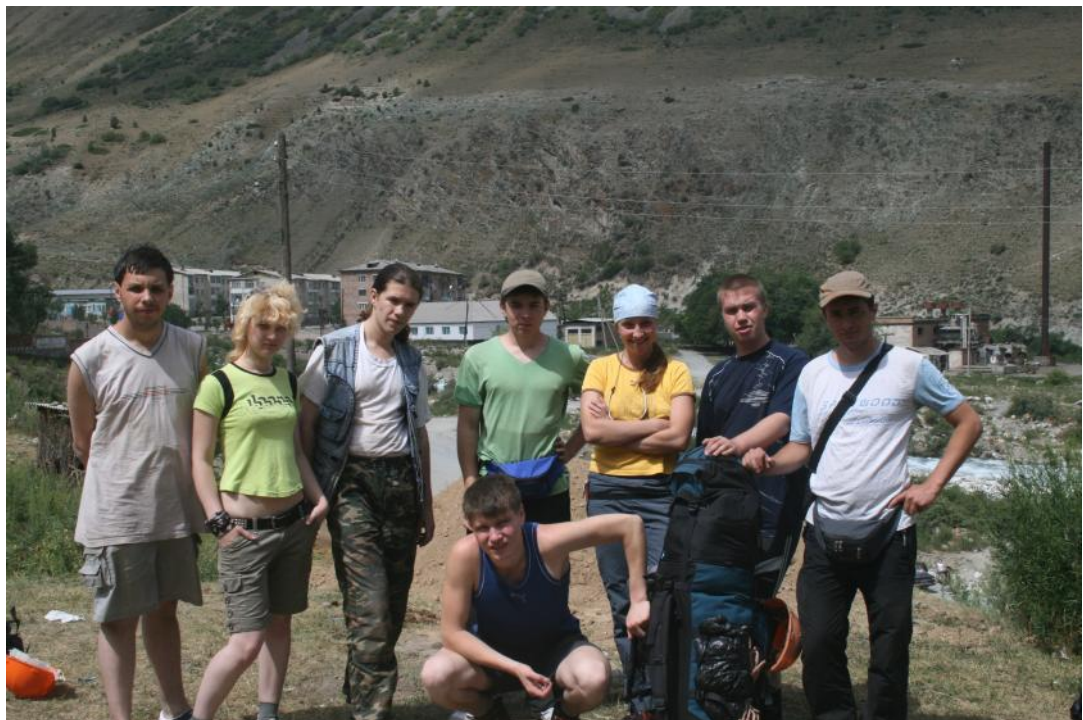
Фото 2. Группа перед выходом на маршрут