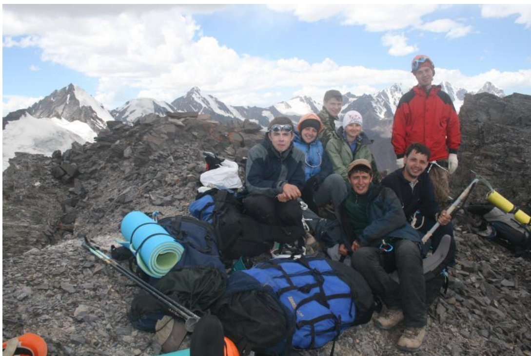
Фото 19. Группа на седловине пер.Иссык-Ата Вост. (1Б,4090)