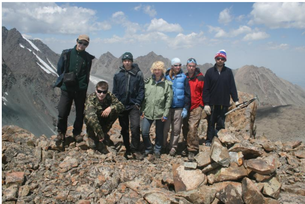
Фото 26. Группа на седловине пер.Буревесник (1Б,4200)