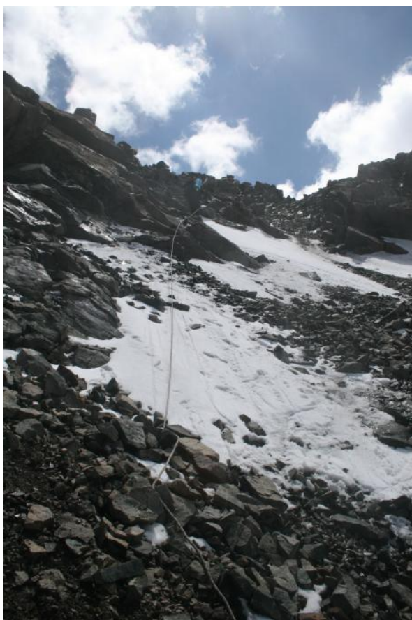
Фото 27. Участок перильной страховки на спуске с пер.Буревестник