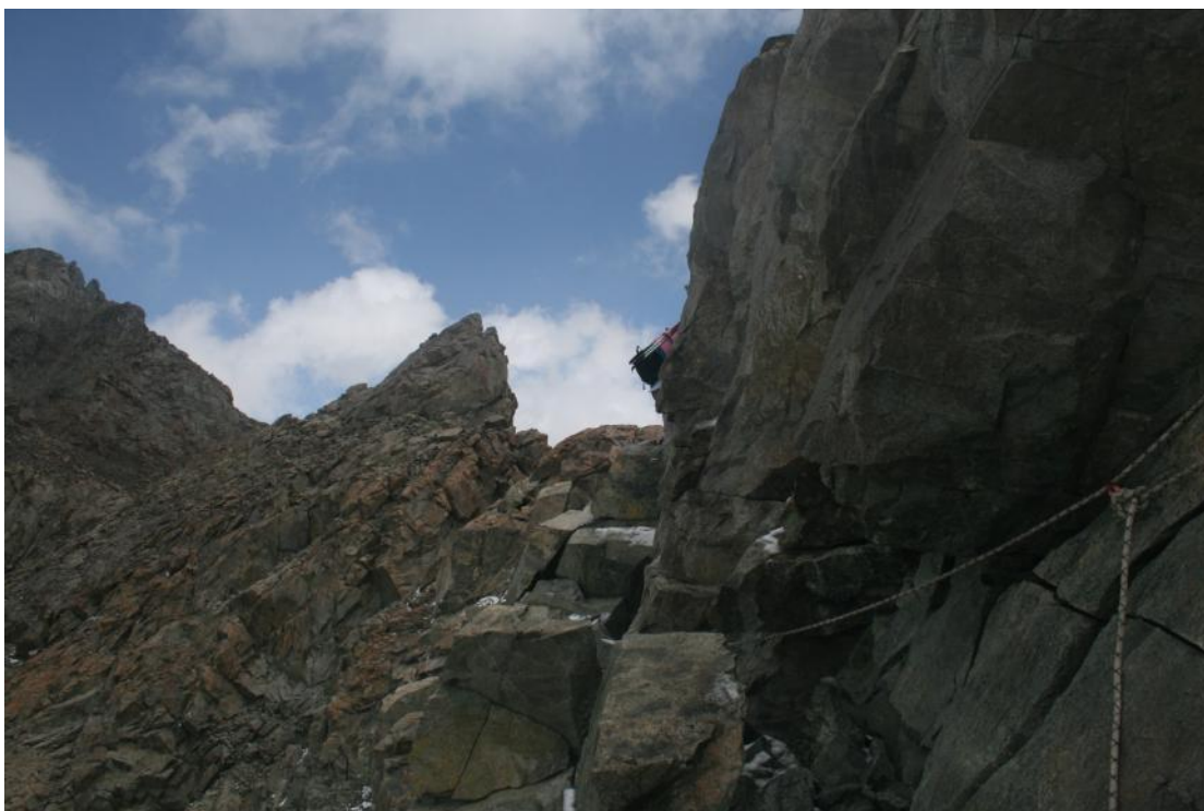
Фото 33. Участок траверса на гребне перевала Чертов палец