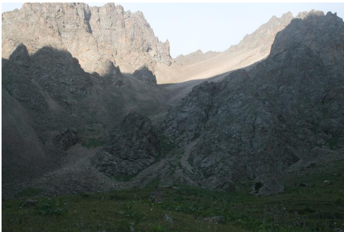
Фото 5. Перевал 274. Снят от р.Батый