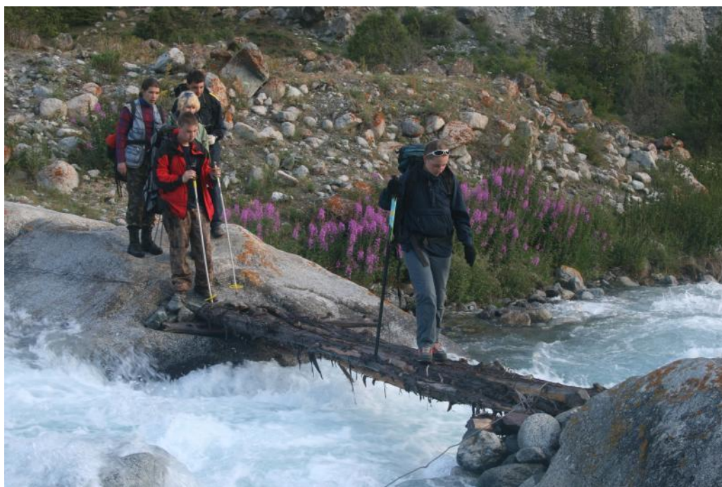
Фото 4. Переправа через р.Иссык-Ата ниже устья р.Батый