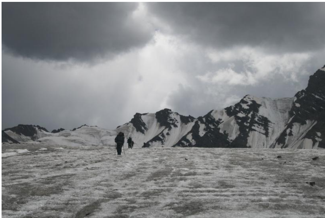
Фото 21. Спуск по лед.Батый