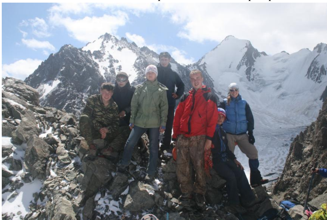
Фото 32. Группа на седловине пер.Чертов палец