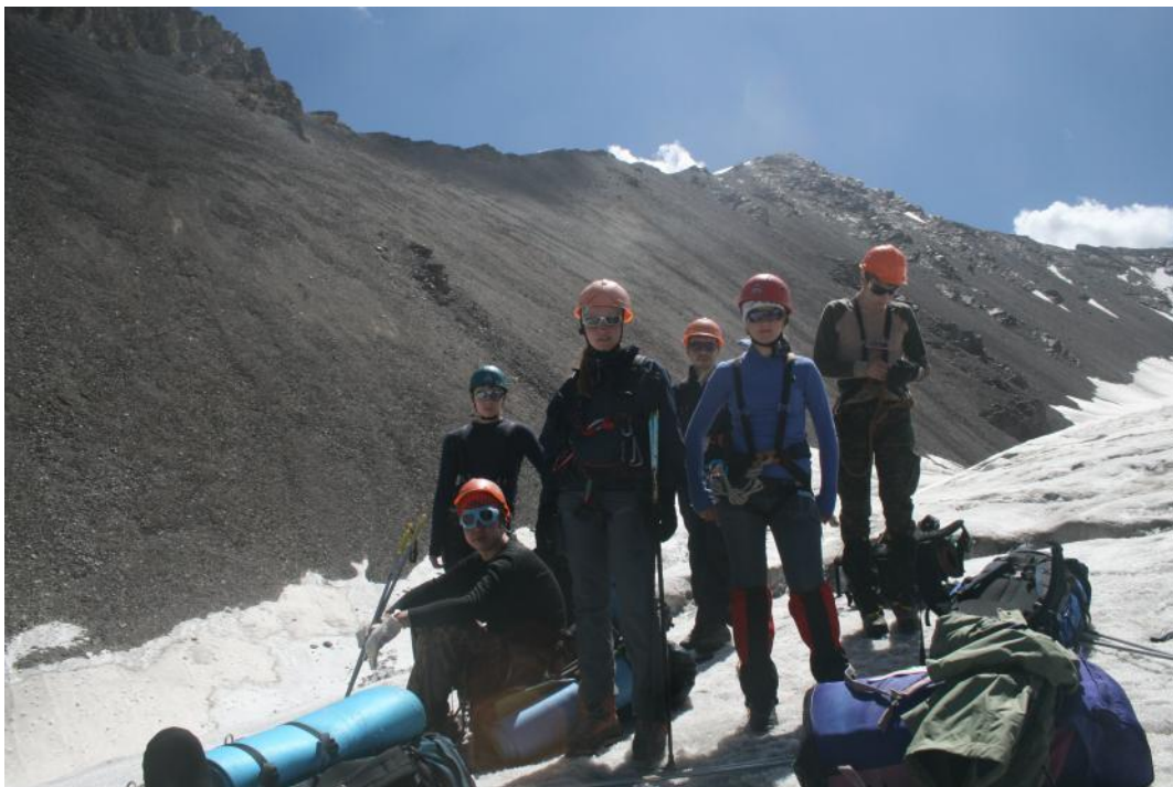
Фото 17. Группа под перевалом Иссык-Ата Восточный