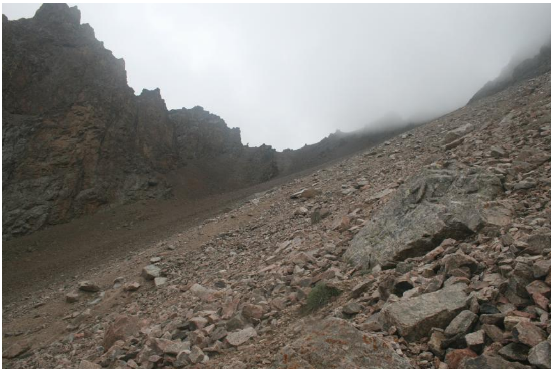
Фото 7. Перевальный взлёт пер.274