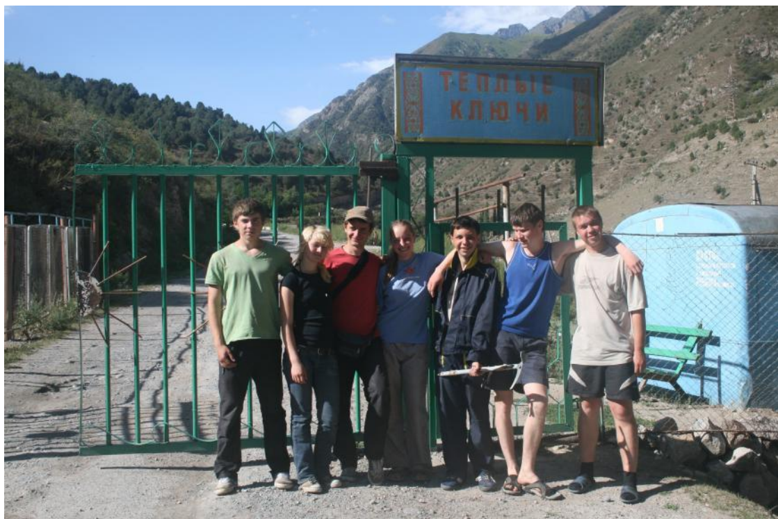
Фото 38. Группа в пос. Тёплые ключи у автобусной остановки