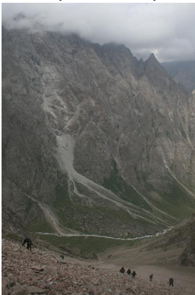
Фото 6. Подъём на безымянный перевал (№ 274)