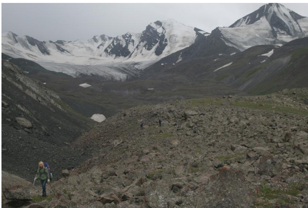
Фото 22. Движение по долине р.Батый