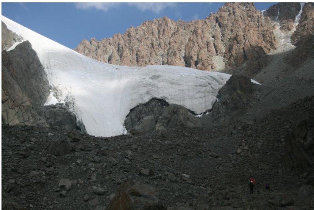
Фото 25. Ледник на восточном склоне пер.Буревестник