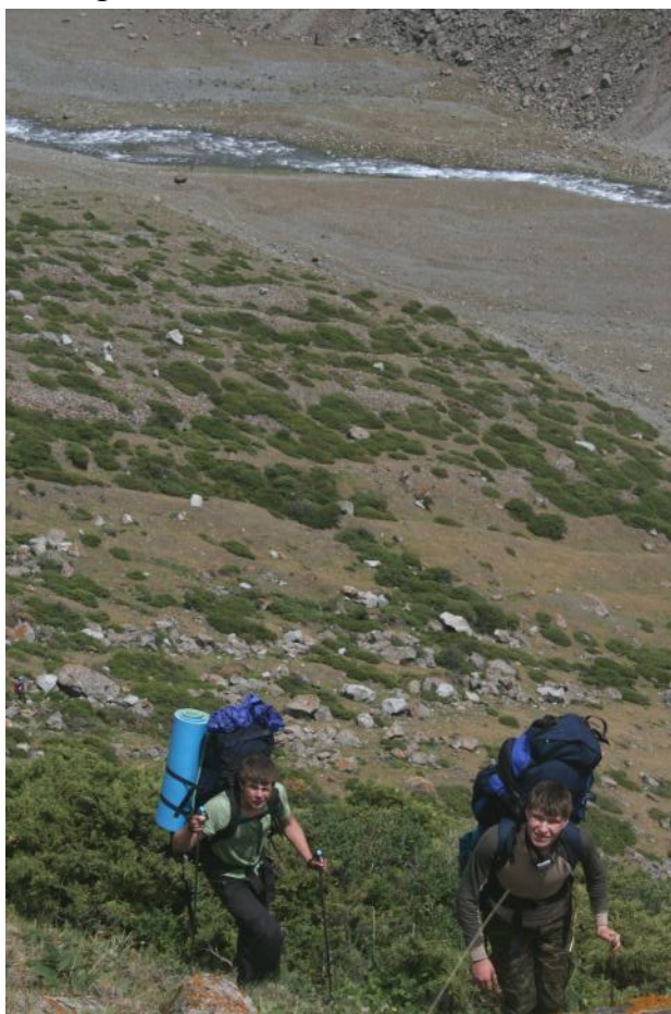
Фото 24. Подъём в висячую долину под пер.Буревестник