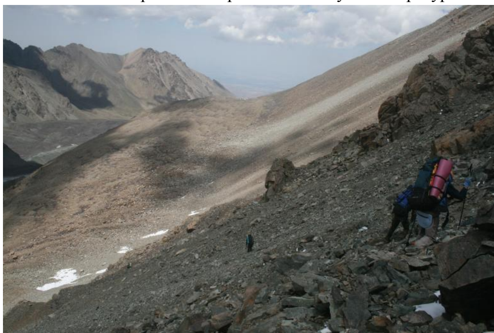
Фото 28. Ниже склон выполаживается