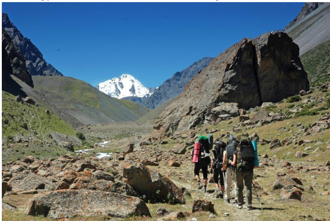
Фото 10. Скала Джарташ в долине р.Иссык-Ата