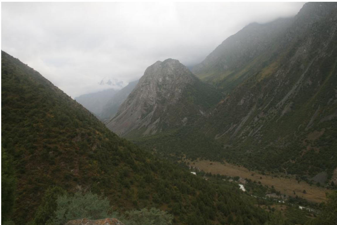
Фото 37. Долина р.Аламедин