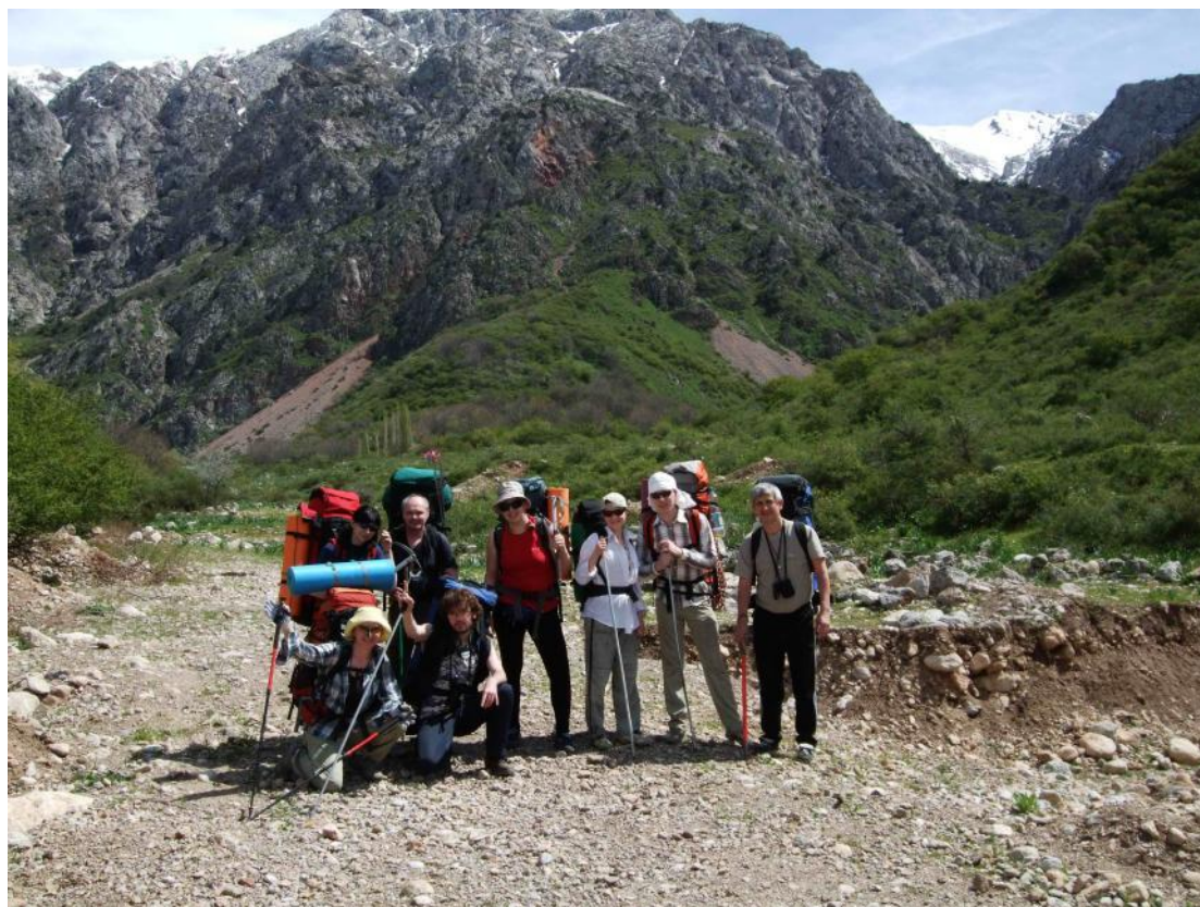
Фото 1. Начало маршрута (пос. Бургулюк).

До пос. Бургулюк доехали на внедорожниках. Температура 25-30 градусов. Отм. 1265 м . 14:45. Традиционная общая фотография на старте – и в путь (фото 1).