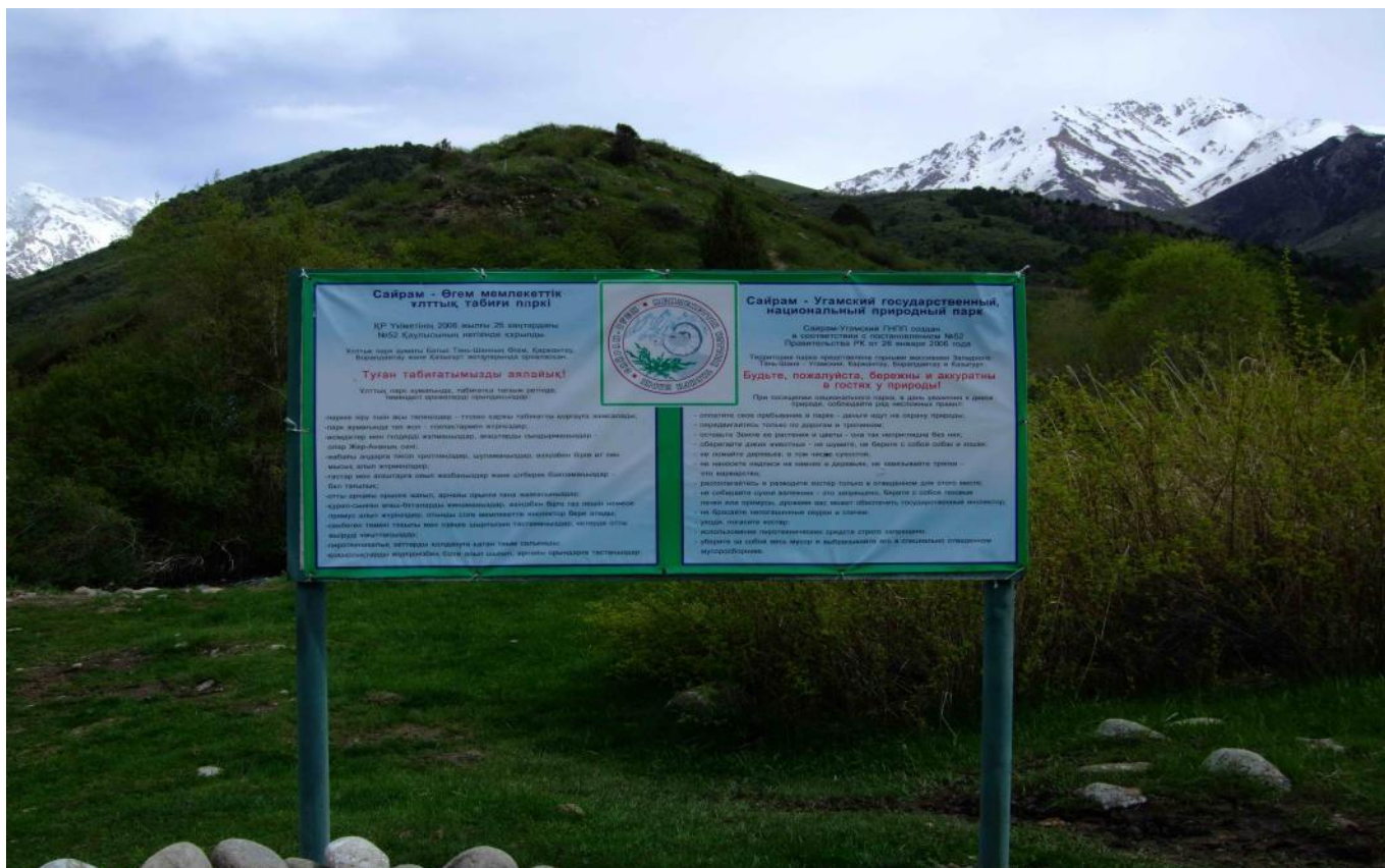
Фото 10. Граница заповедника.