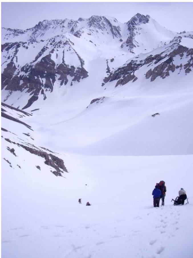
Фото 8. Вид на реку Сарыайгыр со стороны перевала Текенек.

После этого стали спускаться по руслу реки Сарыайгыр (фото 8 и 9).