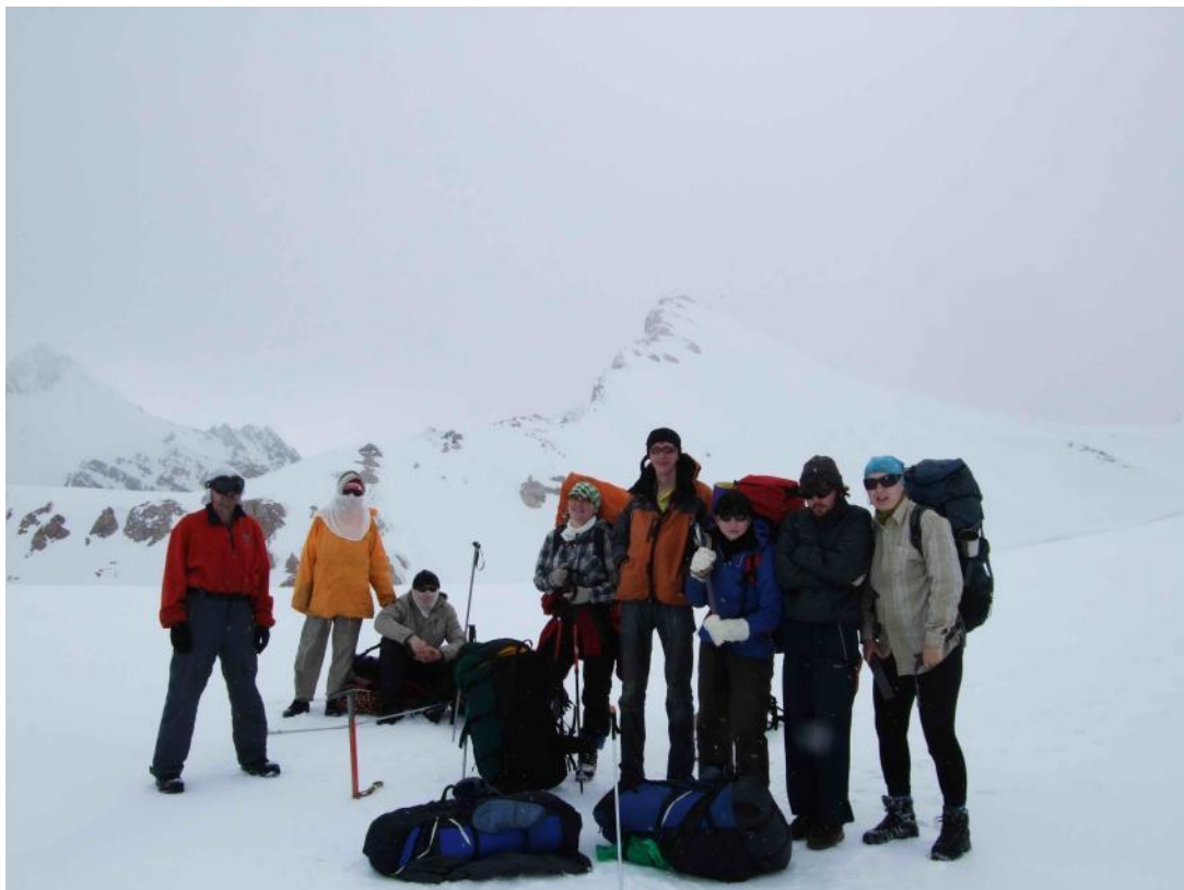
Фото 6. Около перевала Новичок

Подъем ранний, чтобы успеть захватить наст, пока не поднялось солнце и снег не начал проваливаться. Поднялись на вершину 3292 м и пошли мимо перевала Новичок (1А, 3250 м, 9:45 ) на перевал Текенек (1А, 3230 м, 10:05 ). На обоих перевалах сделали традиционные фото (фото 6 и 7).