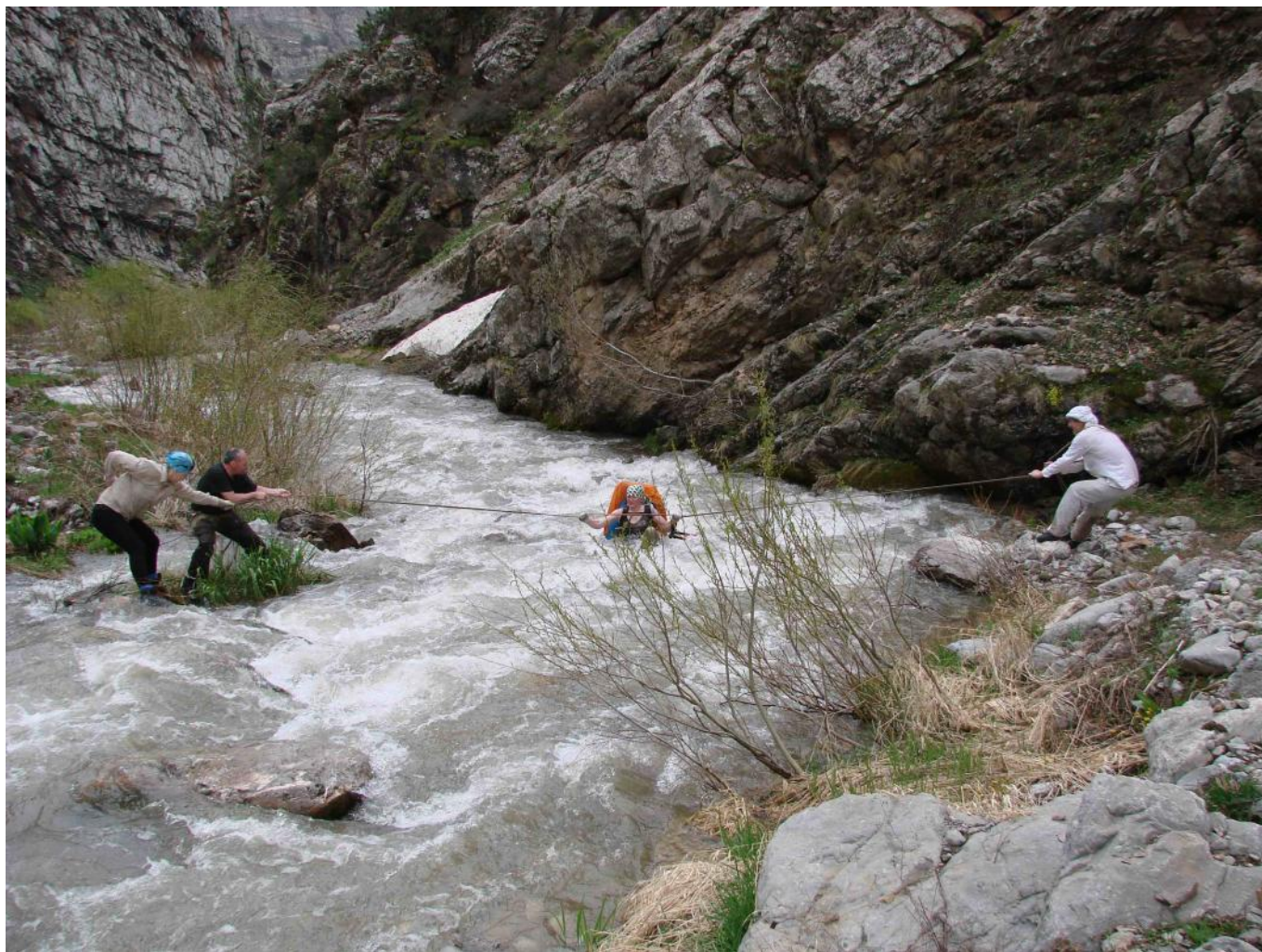
Фото 4. Переправа через приток р. Тогутба

Вышли поздно – в 12 часов , так как с утра снова шел дождь. Шли по правому, довольно каменистому, берегу реки без названия, впадающую в р. Тогутба. Погода наладилась, выглянуло солнце. Очень красивые скалистые берега. Уперлись в прижим. Нашли место для переправы через речку. Решили использовать веревку, так как течение довольно сильное, а ширина примерно 10 м. Кое-кто даже «искупался» (фото 4).