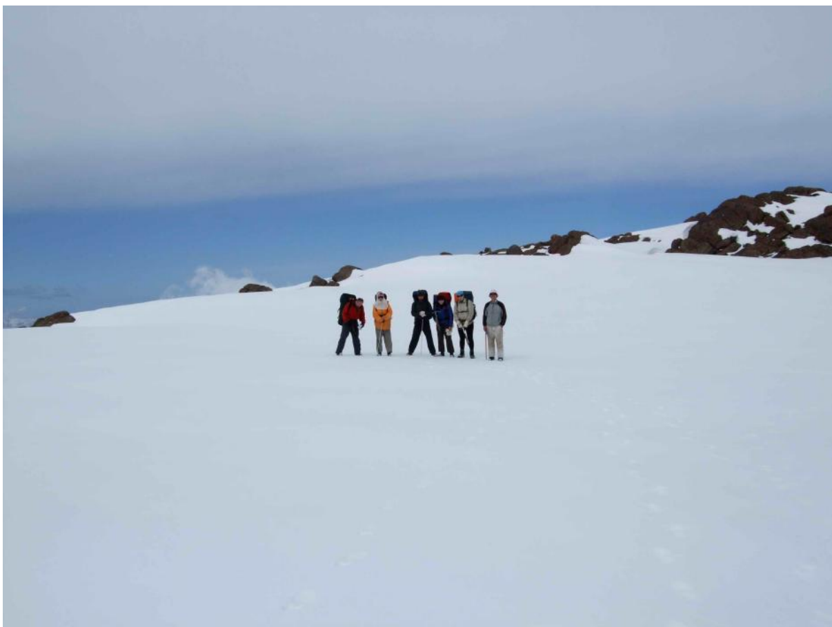
Фото 7. На перевале Текенек.

С перевала сняли записку ( гр. Туристов из г.Кызылорда под руководством Керхер Е.Г. в составе 6 человек вышла на Новичок 11 сентября 2006г. В 14:00 Продолжаем движение в сторону оз.Сусинген. Самочувствие у команды хорошее ). Оставили свою записку.