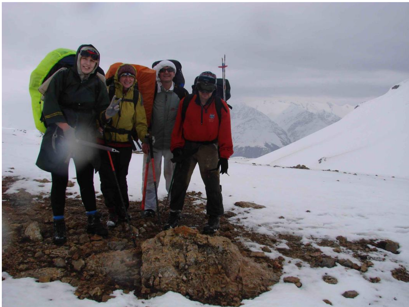
Фото 3. На перевале Улучур.

13:30. Обед. Все активно утеплились, так как дует холодный сильный ветер. Увидели огромного орла. Снег уже везде, сколько видит глаз, но покров еще небольшой, идти легко. Ветер немного стих, даже выглянуло солнце. 14:40. Небольшой привал. С этого момента начался снег, снег, снег. Иногда проваливаемся по колено. Ноги у всех стали мокрыми, так как снег сырой. Дошли до русла реки, снега еще больше. С этого момента начали торить тропу по очереди. Повернули влево от небольшого снежного карниза и начали подниматься на перевал Улучур (1А, высота 2666 м). Поднялись в 17:20 (фото 3)