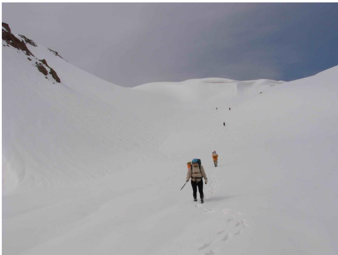
Фото 9. Вид с реки Сарыайгыр в сторону перевала Текенек.

Спуск затяжной, снег уже стал подтаивать, опять проваливались по колено. Склоны лавиноопасные, поэтому выбираем для движения затененные и пологие участки, исключая подрезание склона. Вышли к долине реки Сарыайгыр. Видели последствия схода лавины. Стали все больше попадаться бесснежные участки.