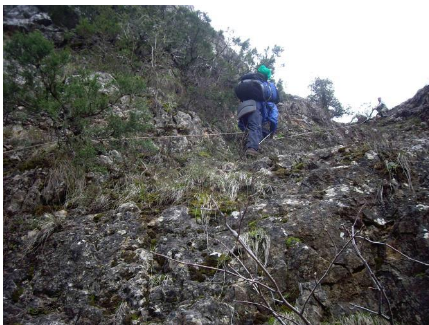
Фото 5. Обход каньона. Подъем по верёвке.

Вышли в 9:45 . Прошли совсем немного вверх по реке Айгыржиккансай.и встретили на пути препятствие в виде великолепного водопада, который бил из скалы с высоты примерно 15 м. Решили обойти его справа, поднимаясь вверх по крутому глинисто-каменистому склону. За первым водопадом оказался каньон с еще одним водопадом. Во время подъема пошел дождь, что осложнило передвижение. В двух местах поднимались с использованием веревки (фото5).