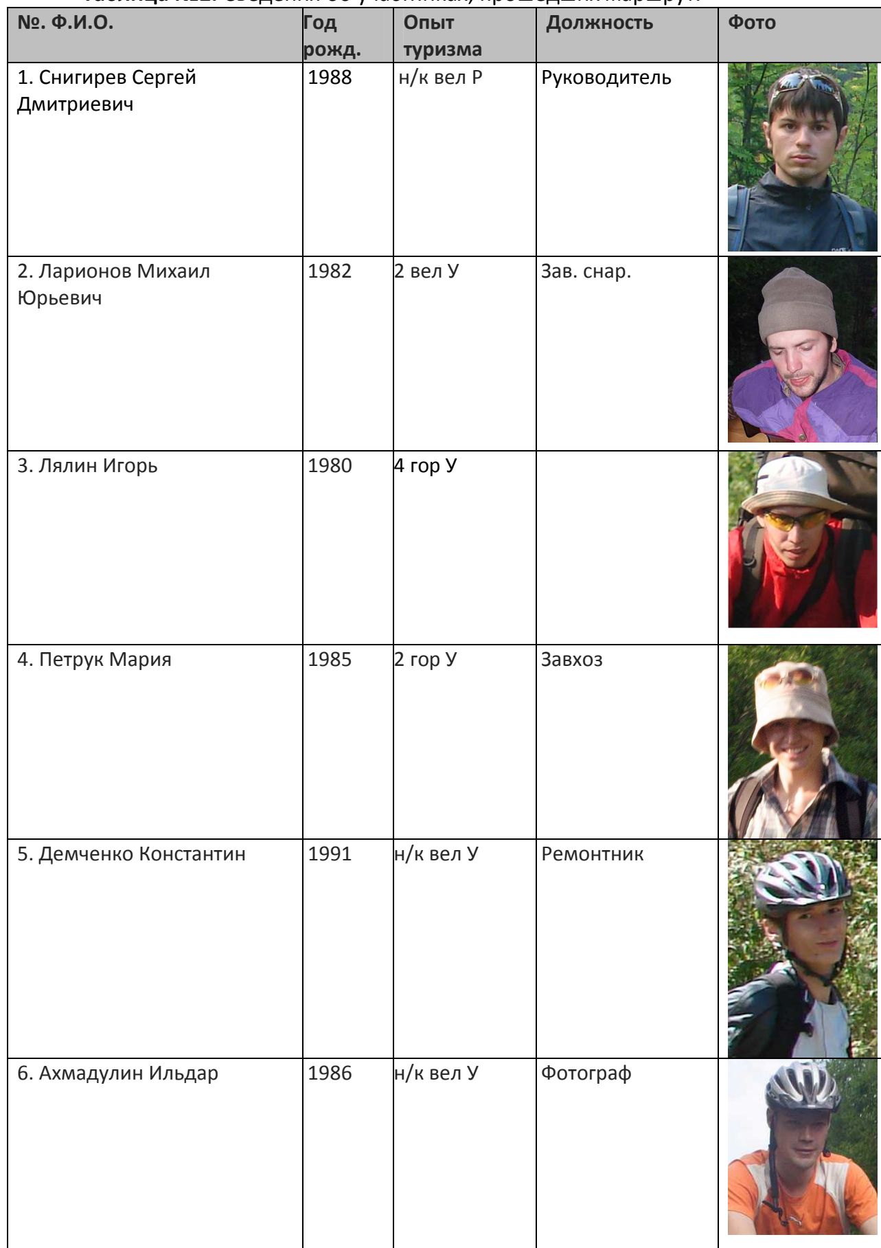
Таблица №2. Сведения об участниках, прошедших маршрут.