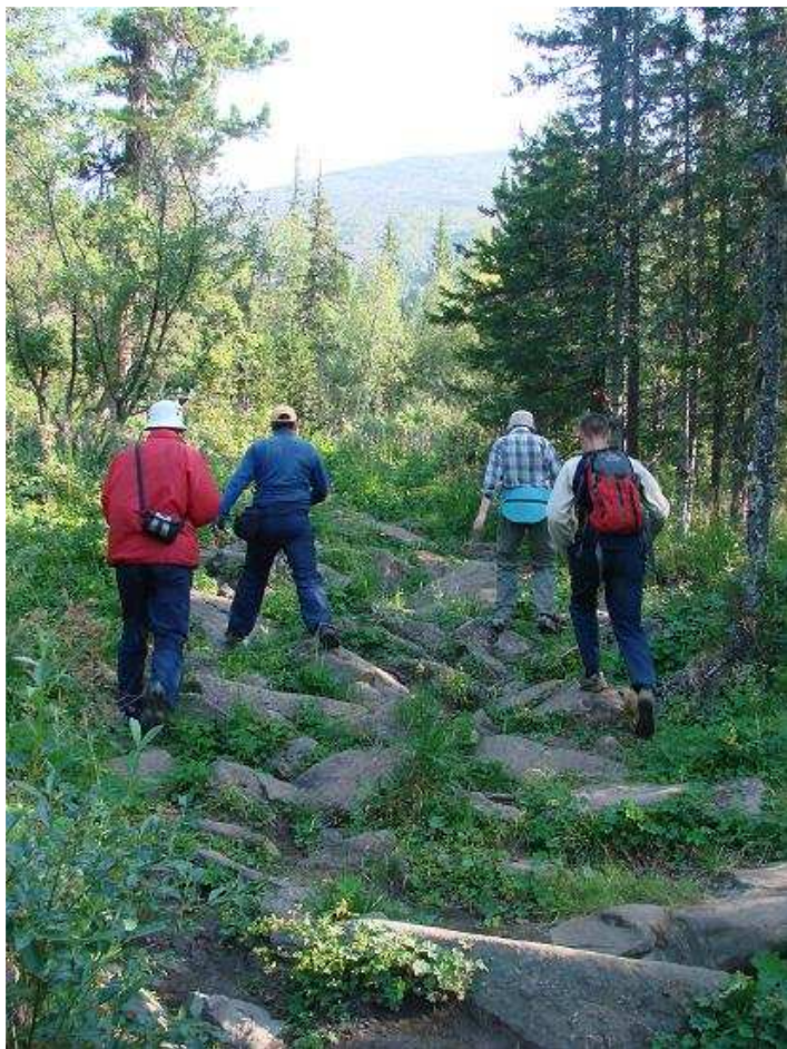
Встречаем памятник «300 лет уральской металлургии».